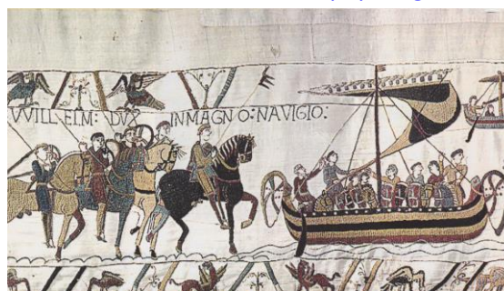
Detail of the Bayeux tapestry, 11 th century, Bayeux

Vous approfondirez certaines parties du programme enseigné en français en étudiant des périodes de l'histoire du Royaume-Uni et des Etats-Unis comme la conquête normande de l'Angleterre au Moyen-Age ou les migrations irlandaises vers les Etats Unis au 19 ème siècle. En géographie, le programme vous permet de consolider les notions de développement durable ou de risque par exemple à travers des études de cas localisées dans des pays anglo-saxons.